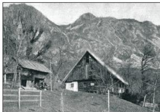
Rojstna hiša Antona Janše na Breznici na Gorenjskem.